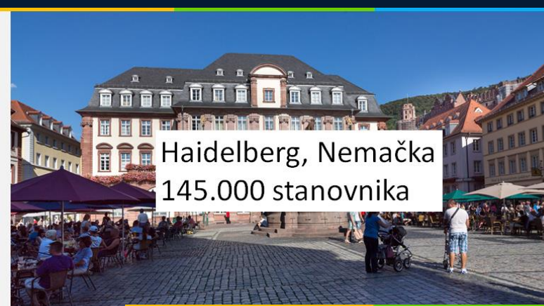
Haidelberg, Nemačka 145.000 stanovnika