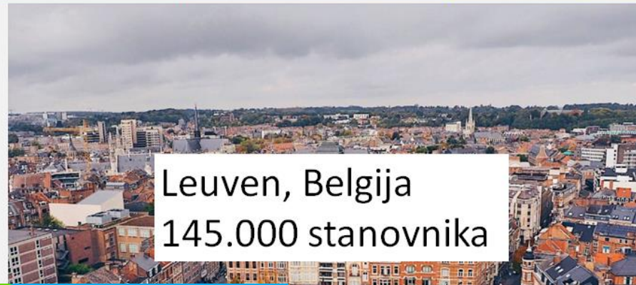
Leuven, Belgija 145.000 stanovnika